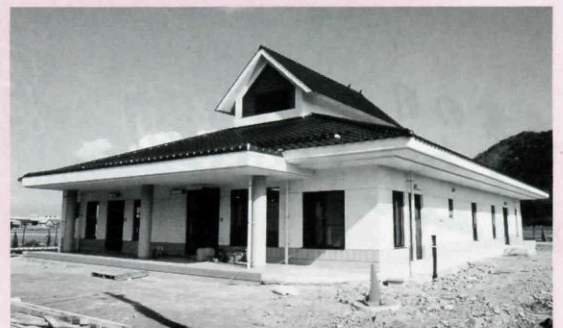
豊原地区農業集落排水処理場