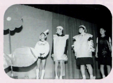
明倫小の発表も楽しみです