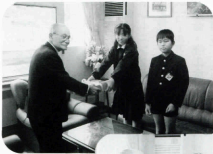
▲浅田小学校より募金