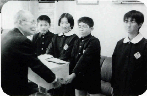
▶明倫小学校より募金

昨年(平成7年)の10月から12月末にかけて、各地で共同募金運動が展開されました。本町でも、これまでに地域住民の方々を始め、各事業所等からの温かい善意により、たくさんの募金をいただきました。歳末たすけあい運動には小学校の皆さんからも、たくさんの善意が寄せられました。