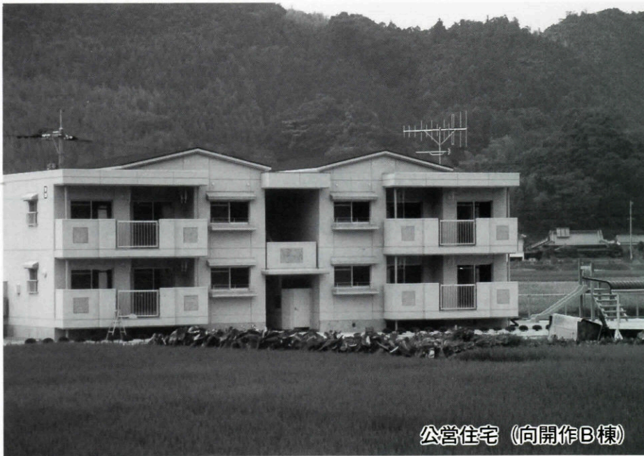
公営住宅 (向開作B棟)