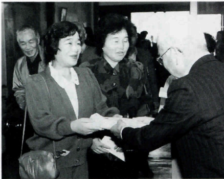
山中教育長から記念品の贈呈

国眼さんは、「初めて訪れたのに……光栄です。」とうれしさを隠しきれない様子でした。