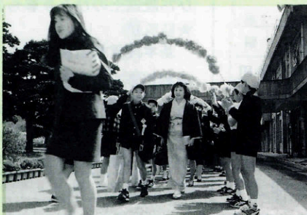
▶明倫小玄関で在校生の見送りを受ける卒業生

3月22日、老人センターにおいて、寿大学の落第式があり、83名の大学生が単位が取れず落第しました。