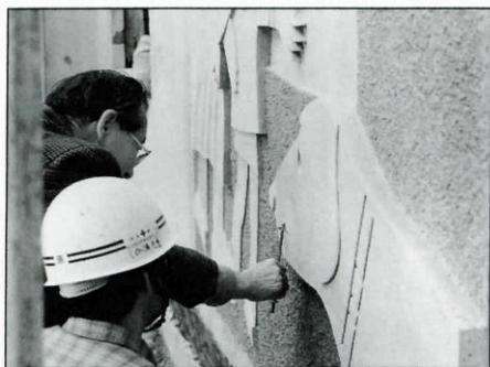
レリーフは館長自らの手で