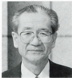
三隅町立香月美術館長

本町においては21世紀に即応したまちづくりの一環として「文化の里づくり」整備事業を推進しておりますが、その核となる町立香月美術館が、町民の皆様のご理解とご協力により、この度、開館となりました。この美術館が町民皆様をはじめ、全国の美術フ