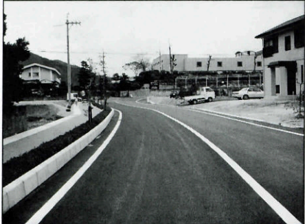
関連道路も整備されました