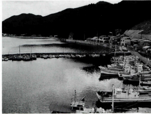
昭和53年頃の野波瀬漁港