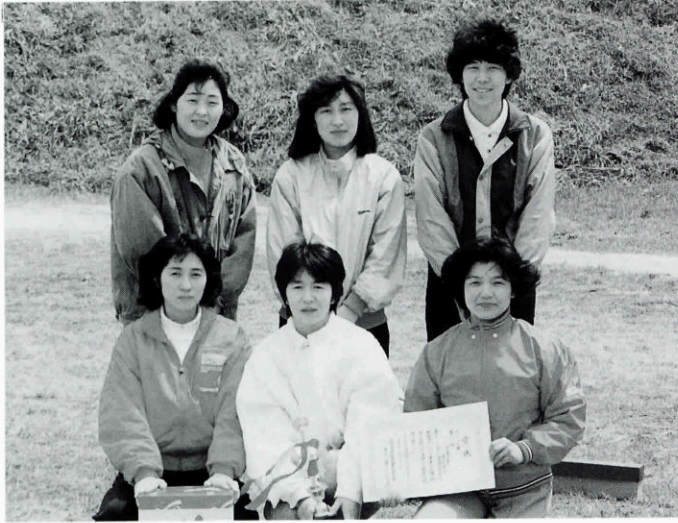
「婦人防火クラブ豊原支部の選手のみなさん」

四月十一日(日)に長門市 深川河川敷において長門地 区消防操法大会が開催されま した。本町からは、消防団四 分団(沢江・浅田・小島・豊 原)が消防団操法に、婦人防 火クラブ二支部(浅田・豊原) が婦人バケツ消火競技に出場 しました。 当日は、小雨もパラつき、 悪コンディションに もかかわらず熱戦が 繰り広げられ、見事、 婦人防火クラブ豊原 支部が入賞しました。 また、午後からは 親睦を深めるため、 消防団のソフトボ ル(小島分団、豊原 分団出場)や婦人ト