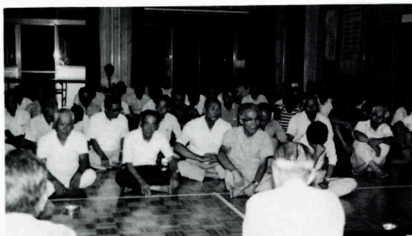
八月二十三日 第六ブロック会場

等となっております。まだまだ個々に貴重な提言等が沢山ありますので、懇談会の結果を十分に検討し、二十一世紀に向け、活力とうるおい、そしてやすらぎのあるまちづくりを強力に推進して行かねばならないと思えます。