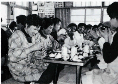
▶ 沢江食改推員さん

「これなに？」いわしで作ったハンバーグとかばやきだって……………。 「意外においしいわよ。」「本当、晩のおかずにええねえ。つくり方も簡単でえねえ。」「おむすびも、きれいねえ」……………と。 出された料理をかこんでベチャクチャ話がつきません。 (福江・中野・大谷)