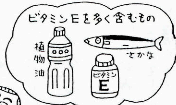
ビタミンEを錠剤の形で1日150~300mgあわせてとるとよいでしょう。

が、酒は飲めば飲むほど血栓を防ぐ働きが高まるわけではないということ。あくまで各人における適量をもってはじめて、血栓を予防するのに有効ということなのです。納豆にも非常に強力な血栓溶解酵素（ナットウキナーゼ）といいいネバネバ中に含有）が認められています。要は適量と