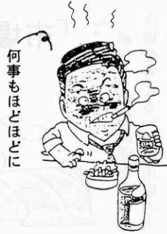
何事もほどほどに