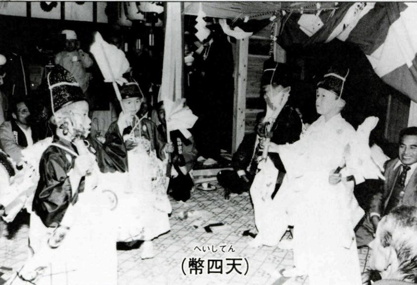
へいしてん (幣四天)