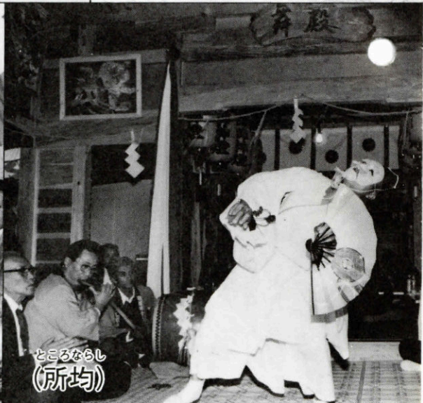
ところならし (所均)