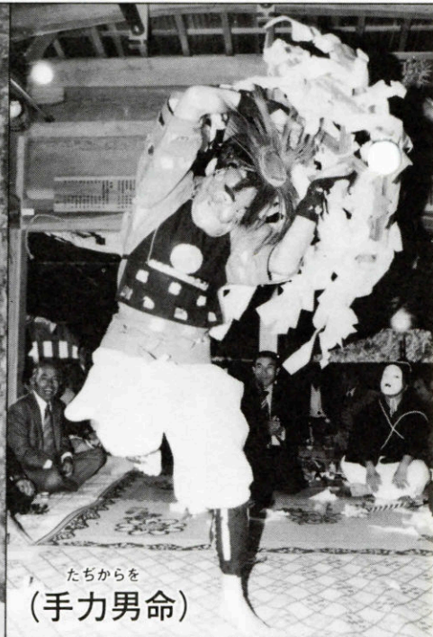
たちからを (手力男命)