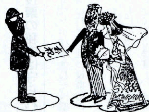
結婚のお祝い金やお祝い品

悔なくまかせられ、あなたの幸福とあすへの希望が期待できるように、有権者も日ごろから心がけましょう。