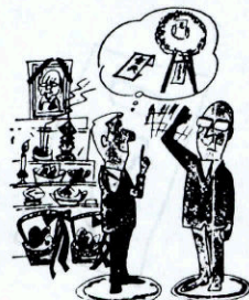
お葬式の香典、花輪、供花