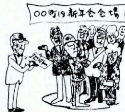
集会などの飲食代