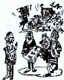
お祭りなどの寄附、お酒など