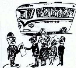
団体旅行の寄附や差し入れ