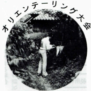
木リエンターリング大会

小学生(高学年対象) 中学・高校・一般 徒歩によるOL 勤労者 スポーツセンター 9:30~12:00