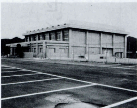
(三隅勤労者スポーツセンター)