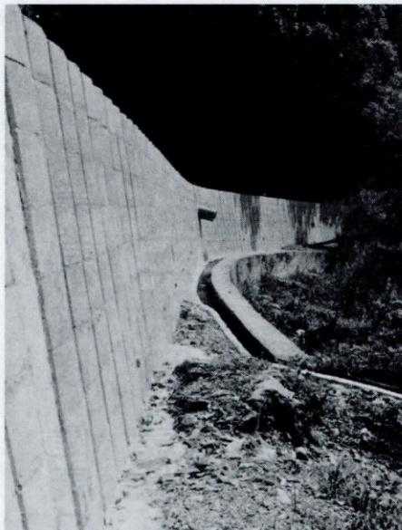
(杉山林道局部改良)