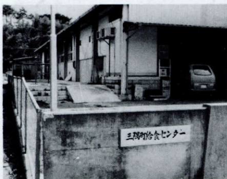
(給食センター排水処理施設)