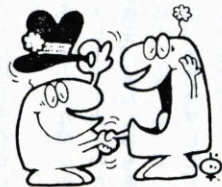
楽しい一日は あいさつから

を經過し老朽が激しく、これまで毎年修理を実施して来ましたが、今後益々この老朽化が進むにつれて、近く大修理をしなければ居住できないものと推察されますので大修理における入居者の仮住居の問題、入居者の持家に対する強い願望、あるいは入退居者の変動が無く固定化している事、又、公営住宅法に基づく譲渡処分の承認基準に適合している等々を考慮し譲渡することにしました。 昨年建設大臣に譲渡処分承認申請を提出しましたところ、今回承認が決定いたしましたので、入居者に対して、譲渡価額のうち住宅家屋は法に基づく複価額、敷地については、不動産鑑定士の評価額により夫々売買契約を締結しました。 今後、当該住宅は各入居者の持家として夫々維持管理することになりました。 この住宅譲渡に伴う代金は、公営住宅建設基金として別途積立て本年度以降計画的に進めております住宅建設資金として使用することとしています。 なお、本年度は殿村新開に、簡易耐火構造二階建六戸及び幼児遊園を現在建設中ですが、これらの入居者公募については、年末ごろおこなう予定しております。