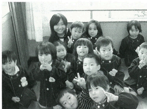
◀ 保育園での就業体験

10月4日～8日まで2年生全員が行いました。ご協力いただいた企業・施設の皆様ありがとうございました。今後の学習の深化に役立つものと思います。