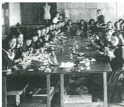
昭和27年の手芸授業

平成18年には本校は創立百周年を迎えます。現在百周年に向けて多くの準備がなされております。百周年記念碑(沿革碑)の概要が決まりました。黒御影石を使用し屏風型のを校舎玄関前の中庭に設置予定です。向津具分校跡地にも跡地碑を設置します。俵山分校跡は既存のものが設置さ