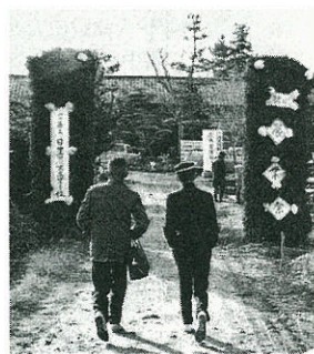
昭和30年代の農業祭

れています。また、記念史の編纂も進行中ですが百年前ともなると資料等が散逸していて、県立図書館や資料館で膨大な資料を検索中です。特に戦前・戦後の資料が少なく担当者は苦労をしています。学校に関する資料・写真・新聞記事・教科書・ノート・成績表・賞状・卒業証書等なんでも結構ですので、もし倉庫や蔵で見つけられましたら学校までご連絡下さい。