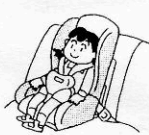
幼児用 (4か月~4歳程度)