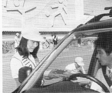
▶ 街頭キャンペーン