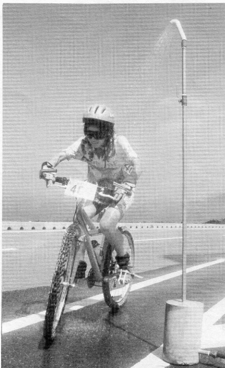
ああ気持ちいい・・・フィードステーション②前

十一日、午前十時半にスタートしたマウンテンバイクによる、三時間耐久レース。一周約3kmのトリッキーなコースを三時間で何周回れるか競いました。一人で走りぬくソロの部、二人で交替するペアの部、三人交替のチームの部、三部門で熱戦が繰り広げられました。女性の参加者も75人と多く、北長門海岸国定公園のタイナミックなロケーションに彼女達のやさしい汗が輝きました。走り終えた選手の多くが、楽しかった、すばらしい大会でした、また出たいとスタツフに声を掛けてくれました。