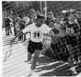
日置小チーム (8区中継所) 狩宿チーム