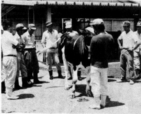
▼ローヤルセレクトアンパンホー号 (ホルスタイン部門 特等)