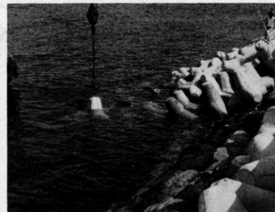
海岸保全事業 (黄波戸地区)